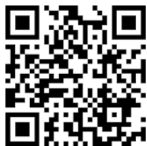
I bambini e il cantiere