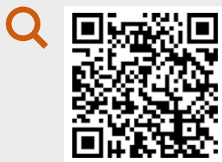
La relazione di Paolo Giuliotti

- nessuna agenzia è capace da sola di conseguire i propri obiettivi, se davvero scommette sull'educazione e non si accontenta di obiettivi intermedi, spesso funzionali più alla società che al giovane: le alleanze sono oggi una necessità;