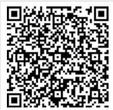
Ennio Antonelli: La missione educativa della famiglia oggi